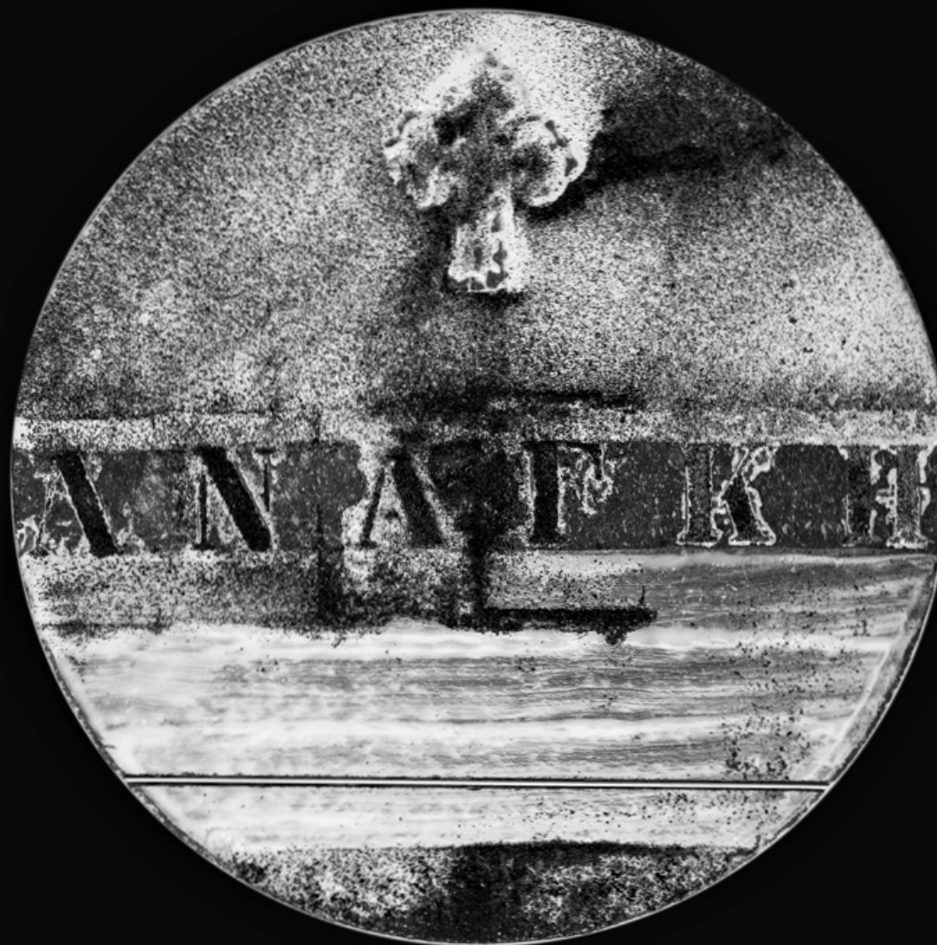
ANANKE – Bisogno Autore: Matteo Fraterno

Dono dei volontari del Servizio Civile al Presidente della Repubblica 3 marzo 2016